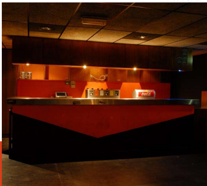
Bar du Kao