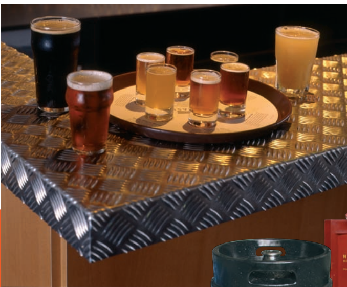
Le panel de nos bières